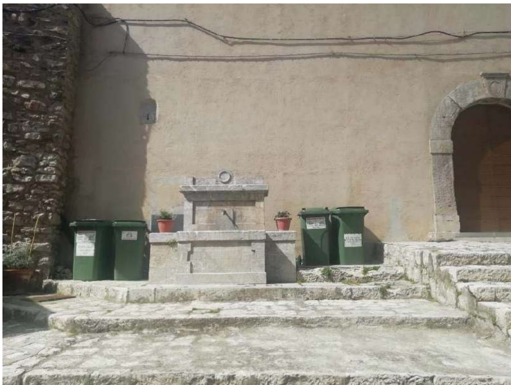
PDI C) Piazza Marconi (Ante castello) PRE-INTERVENTO

Installazione di giardino verticale con piante aromatiche e officinali, prevalentemente Salvia. Installazione di fontana a cascata d'acqua per richiamare il percorso cascate del Vallone del Tuorno. Installazione pannello grafico informativo e colonnina smart che scaricando l'app dedicata e collegandosi allo Smartphone farà partire una guida audio/video relativa al PDI in cui ci si trova.