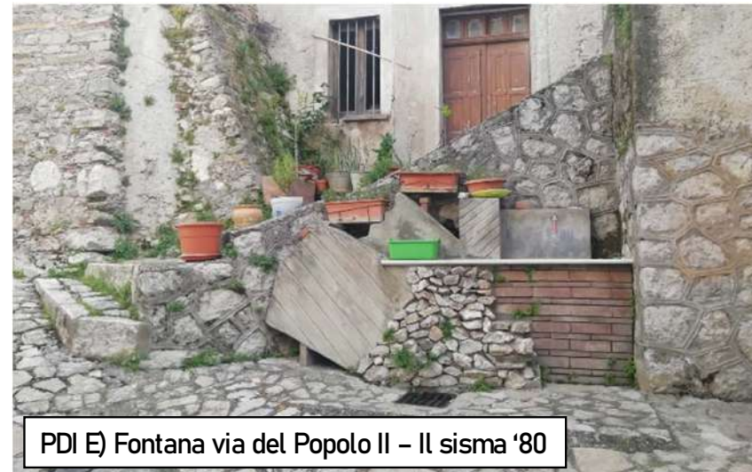
PDI E) Fontana via del Popolo II – Il sisma '80