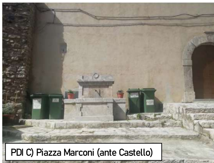
PDI C) Piazza Marconi (ante Castello)