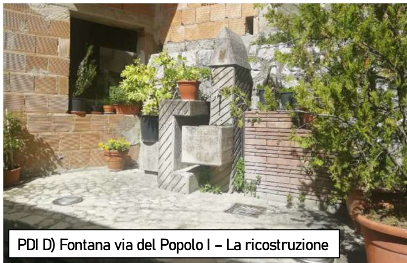
PDI D) Fontana via del Popolo I – La ricostruzione

Attualmente queste versano in uno stato di degrado dovuto al tempo, per tal motivo verranno recuperate senza snaturarne il significato ma, anzi, valorizzandone il significato, incuriosendo il visitatore ad approfondire le informazioni storiche e a visitare il Museo della Memoria.