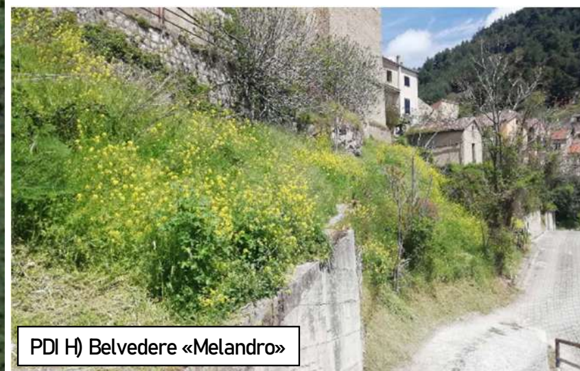
PDI H) Belvedere «Melandro»