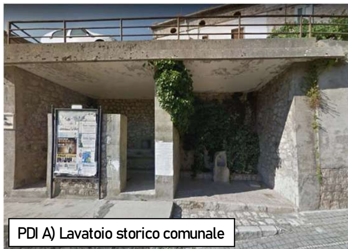
PDI A) Lavatoio storico comunale

Data l'emergenza Covid-19 in atto, questo consentirà di limitare i contatti, senza lasciar il visitatore a se stesso.