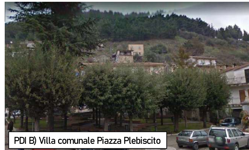
PDI B) Villa comunale Piazza Plebiscito