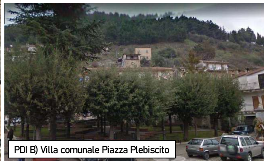
PDI B) Villa comunale Piazza Plebiscito