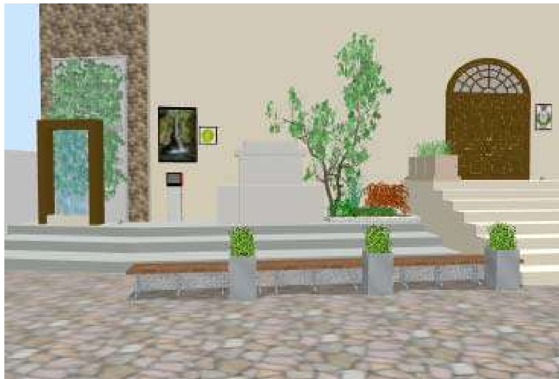
PDI C) Piazza Marconi (Ante castello) POST INTERVENTO