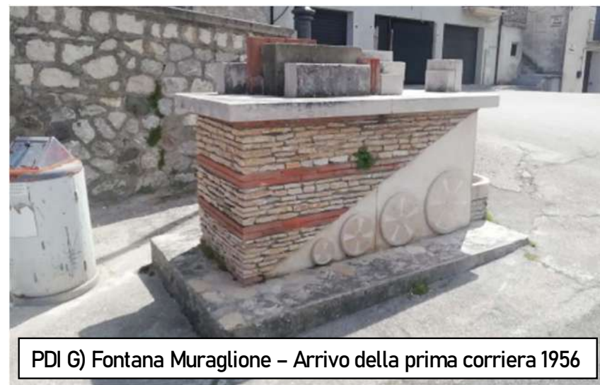
PDI G) Fontana Muraglione – Arrivo della prima corriera 1956