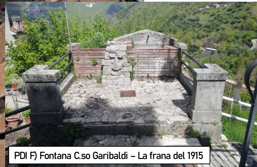
PDI F) Fontana C.so Garibaldi - La frana del 1915