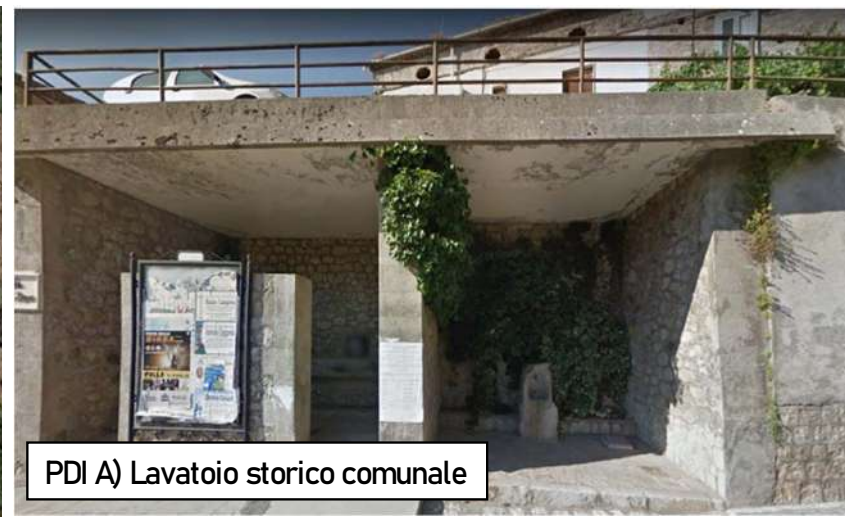
PDI A) Lavatoio storico comunale