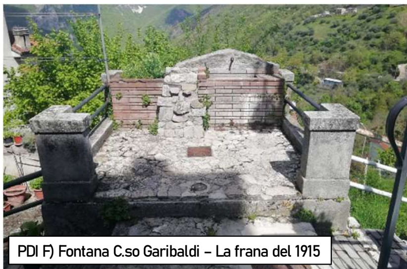
PDI F) Fontana C.so Garibaldi – La frana del 1915