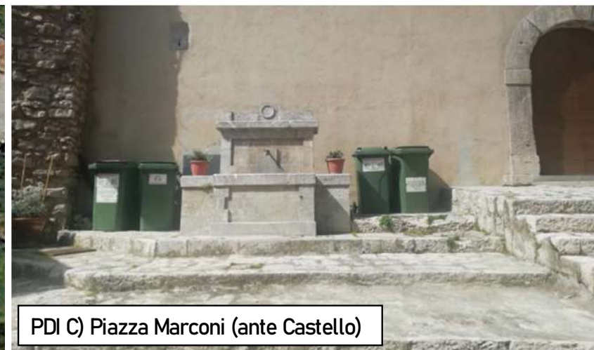
PDI C) Piazza Marconi (ante Castello)